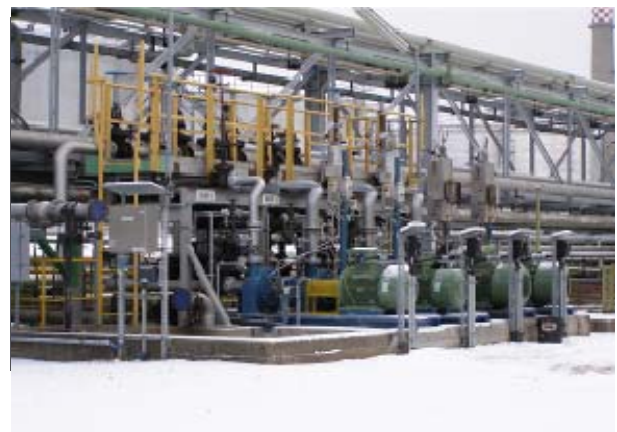
Die W-LAN-Einheit ist für raue Industrieumgebung und jedes Wetter konzipiert.