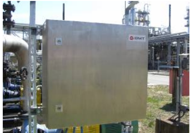
C300_Wireless und überwachte Aggregategruppe – nur StICKKabel müssen verlegt werden.

Optional wird die Einheit mit EX-Trennung ausgerüstet.