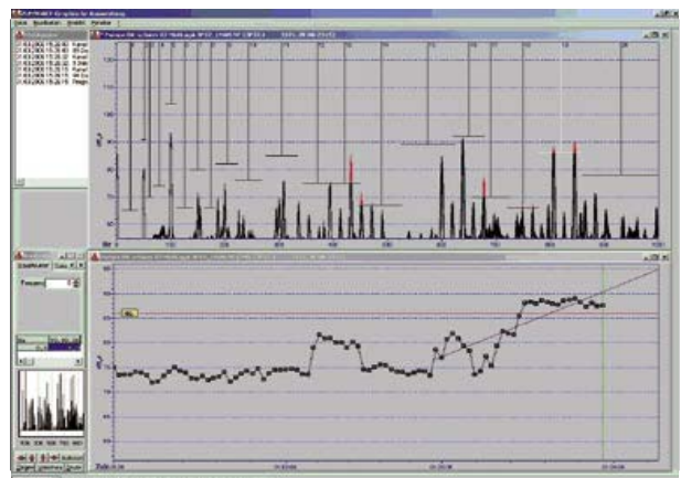
Spektrale- und Trendbetrachtungen machen Instandhaltungsmaßnahmen planbar