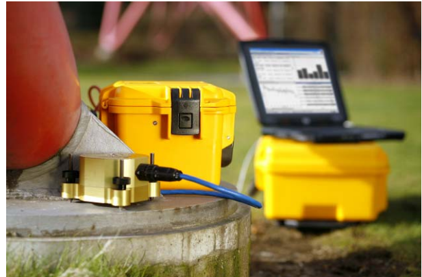
SUMMIT M Hydra – Seismisches Datenerfassungsgerät