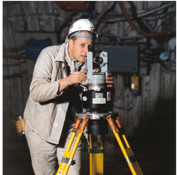
Kreisellotkontrollmessung bei einer Streckenauffahrung unter Tage