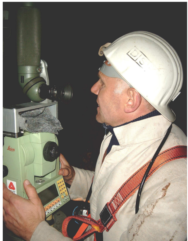
SVP - Schachtvermessung