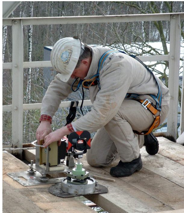
Lotung und Teufenmessung

DMT GmbH & Co. KG Exploration & Geosurvey